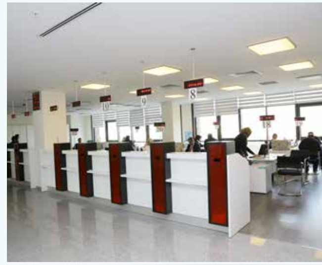
» Kentli Servis

Söz konusu dönemde; tamamı yatırım niteliğinde olan sermaye giderlerinin toplam bütçe gerçekleştirme içindeki payı % 31,06 olmuştur.