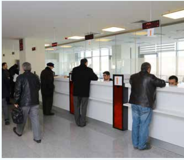
» Merkez Vezne

Belediyemizin 2013 mali yılından Sosyal Güvenlik Kurumu ve Vergi dairesine herhangi bir borcu bulunmamaktadır.