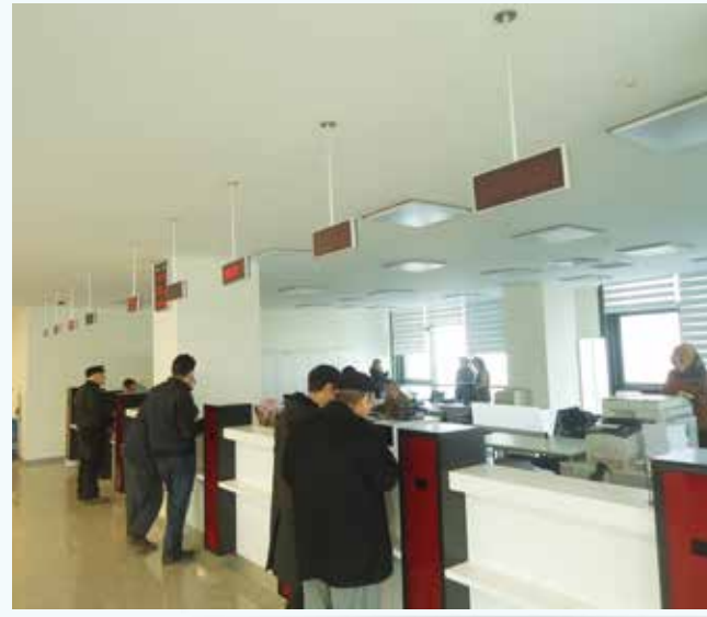
» Emlak Ç.T.V Servisi