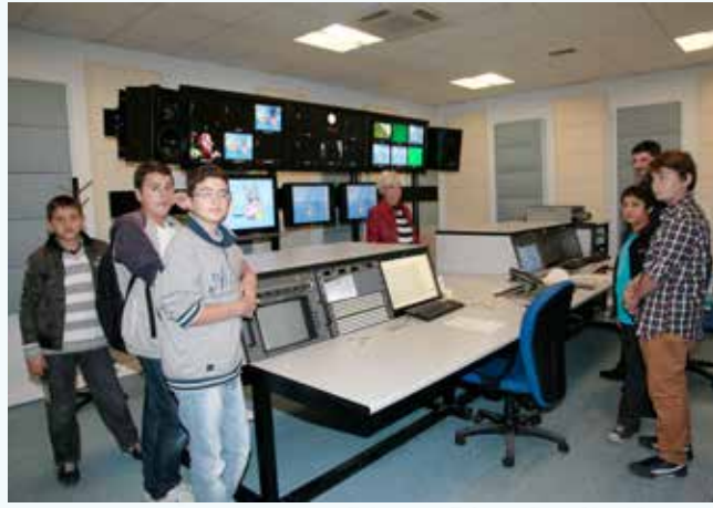
» TRT Çocuk ziyareti

Ümraniye Belediyesi, Kent Konseyi Çocuk Meclisi Üyeleri TRT'nin İstanbul Ulus'taki TRT Çocuk kanalını ziyaret etti. Geziye ilk olarak, TRT canlı yayın stüdyosu ile başlayan çocuklar, canlı yayına başlamak üzere olan stüdyo-daki hazırlıklar hakkında bilgi alarak, canlı yayına şahit oldular. Ardından programların yayına hazırlandığı ofisleri, montaj ve seslendirme stüdyolarını görme fırsatı bulan Çocuk Meclisi Üyeleri, TRT Çocuk kanalının Pepe ve Keloğlan gibi sevilen karakterlerinin yayına nasıl taşındığını yerinde incelediler. Çocuk Meclisi yaptıkları ziyarette, TRT Çocuk HD sanal stüdyolarını da görme fırsatı buldu.