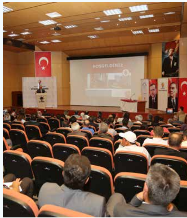
» Sivas Siyaset Akademisi