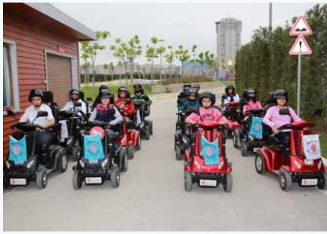
» Trafik Eğitim Parkı Etkinliği

5-9 Mayıs Trafik Haftası olması münasebetiyle birçok etkinliğin düzenlendiği Ümraniye'de, Ümraniye Belediyesi Kent Konseyi Çocuk Meclisi üyeleri Trafik Çocuk Eğitim parkını ziyaret ederek teorik ve uygulamalı "Trafik ve İlk Yardım" dersleri aldılar. Eğitim sonrasında Trafik çocuk Eğitim Parkı'ndaki buz pistine geçen Kent Konseyi Çocuk Meclisi üyeleri eğlenceli dakikalar geçirdi.