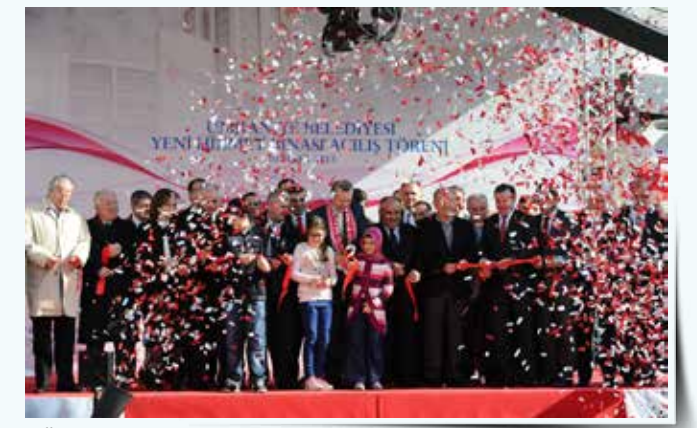
» Ümraniye Belediyesi yeni hizmet binası açılış töreni

Ümraniye Belediyesi, altyapı ve üst yapıda yeni yatırımlar, kültürel ve sosyal içerikli birçok projenin temel atma ve açılış törenlerini gerçekleştirdi. Başkanımız bu törenlerin birçoğuna iştirak ederek halkımızın sevincini paylaşmış ve onlara destek olmuştur.