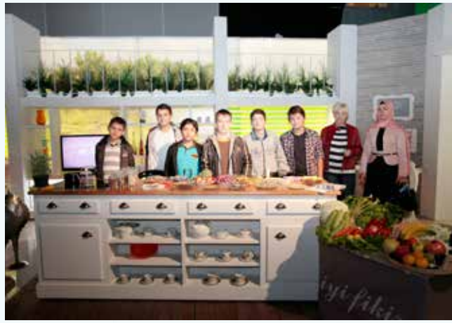
» TRT Çocuk Ziyareti