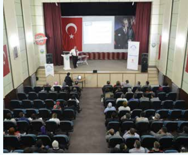
» Giresun Görele Siyaset Akademisi

Ümraniye Belediyesinin başkanımızın önderliğinde yaptığı başarılı çalışmalar birçok kesimin ilgisini çekmeye devam ediyor. Bu senede birçok kurum ve kuruluş başarı öykümüzü dinlemek için başkanımızı davet etti. Gelen onlarca davetten programının uygunluk gösterdiklerini seçerek katılan başkanımız, siyaset ve belediyecilik anlamında tecrübelerini katılımcılara aktardı. Dünya Akıllı Şehirler Zirvesi programına konuşmacı olarak katılan Başkanımız, belediyemiz tarafından kullanılan akıllı belediyecilik sistemleri hakkında bilgi verdi. Siyaset akademisi programları kapsamında Sivas, Tekirdağ, Giresun ve Kocaeli'nde dersler vermiş, ayrıca Bahçeşehir Üniversitesi tarafından düzenlenen Yerel Yönetimler Akademisi'nde öğrencilerle bir araya gelmiştir.