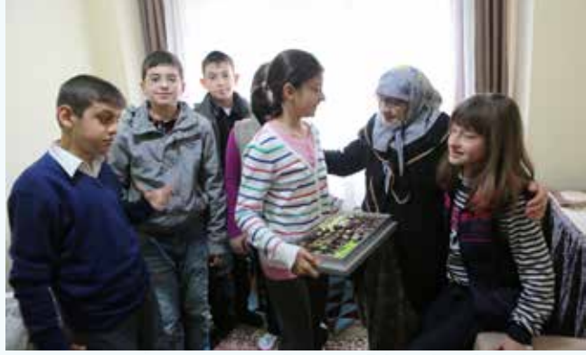
» Yaşlılar Haftası kapsamında ziyaretler

Ümraniye Belediyesi Kent Konseyi Çocuk Meclisi, Yaşlılar Haftası nedeniyle Ümraniye Belediyesi tarafından her gün evlerine sıcak yemek götürülen yaşlıları ziyaret etti. Duygu dolu geçen ziyaretlerde mutlulukları gözlerinden okunan yaşlılar duydukları memnuniyeti ifade ederek, Kent Konseyi Çocuk Meclisi üyelerine mendil armağan ettiler.