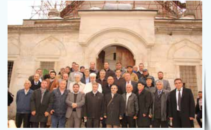
» Bulgaristan-Ahmed Davutçözü Sempozyumu