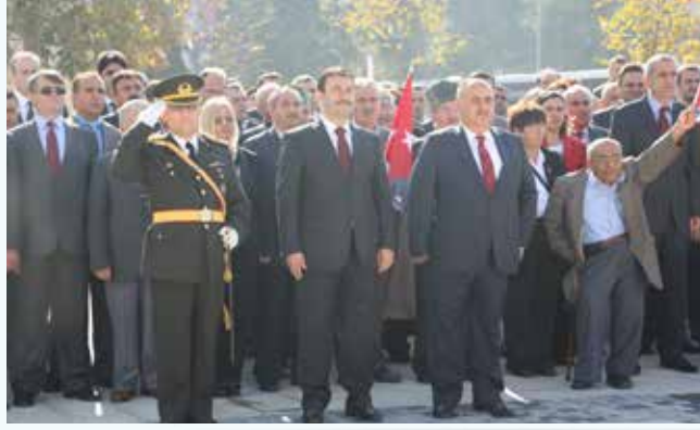
» Resmi Tören

Dini bayramlarda vatandaşlarımızla bayramlaşmalar düzenlenmiş, başkanımız binlerce Ümraniyeliyle bir araya gelmiştir. Çeşitli ikramlar, çocuklarımıza hediyeler, ihtiyaç sahiplerine yapılan yardımlarla renklendirilen bu organizasyonlarla bayram coşkusunun toplumumuzun her kesiminde doyusya yaşanması için çalışılmıştır.